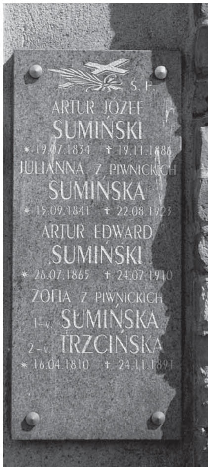
Tablice nagrobne Sumińskich z kaplicy cmentarnej